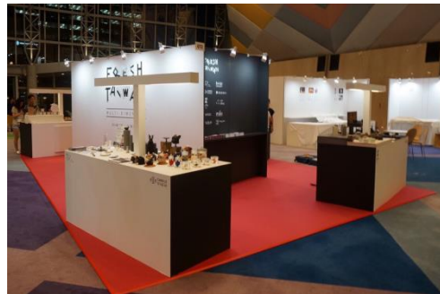
企劃展區示意: 2017 Gift Show- Fresh Taiwan