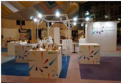
企劃展區示意: 2017 Gift Show- Vibrant Taichung