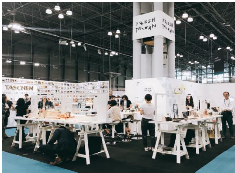
企劃展區示意: 2017NY NOW-Fresh Taiwan