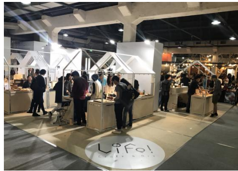
企劃展區示意: 2017 臺灣文博會-Life 展區